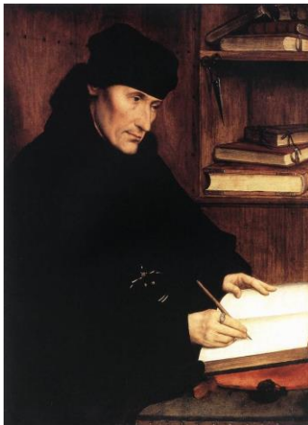
Erasmus de Rotterdam (1469-1536), figura central del Humanismo. Intentó la renovación del cristianismo.