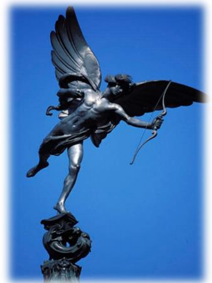
Estatua de aluminio de Eros, Dios del Amor, Shaftesbury Memorial en Piccadilly Circus Londres

Pero, con arreglo a su padre, está siempre al acecho de lo bello y bueno, y es valeroso, resuelto y diligente, temible cazador, que siempre urde alguna trama, y deseoso de comprender y poseedor de recursos, durante toda su vida aspira al saber, es terrible hechicero y mago y sofista (retórico: persuade con las palabras); y su modo de ser no es ni "inmortal" ni "mortal", sino que en el mismo día tan pronto florece y vive -cuando tiene abundancia de recursos- como muere, y de nuevo revive gracias a la naturaleza de su padre, y lo que se procura siempre se le escapa de las manos, de modo que ni Amor carece nunca de recursos ni es rico, y está en medio entre la sabiduría y la ignorancia.